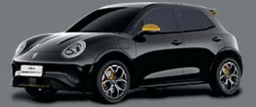
สี Sun Black