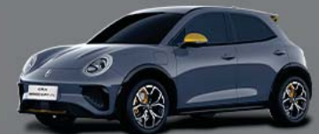
สี Aqua Gray