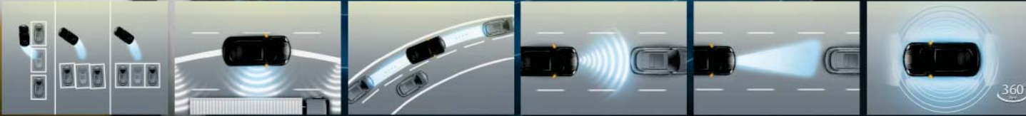
ระบบช่วยจอดรถอัจฉริยะ: 3 รูปแบบ (3 types of Integration Intelligent Parking) ระบบช่วยเสียงการเข้าใกล้รถใหญ่จากด้านข้าง (Wisdom Dodge System) ระบบควบคุมการเบรกขณะเข้าโค้ง (Cornering Brake Control) ระบบช่วยเบรกฉุกเฉินบนทางตรงทางแยก และคนเดินเท้า (Auto Emergency Braking + Intersection + Pedestrian) ระบบควบคุมความเร็วอัตโนมัติแบบแปรผันพร้อมการช่วยเข้าโค้งอัจฉริยะ (Adaptive Cruise Control with intelligent cornering) กล้องแสดงภาพรอบทิศทาง 360 องศา (360° Surrounding camera)