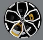
ล้ออัลลอย 18" พร้อมคาลิปเปอร์สีเหลือง