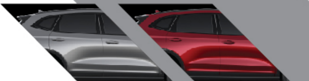
AYERS GRAY : สีเทา