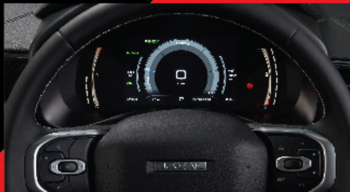
DIGITAL INFORMATION DISPLAY หน้าจอแสดงผลข้อมูลการขับขี่แบบดิจิทัลขนาด 7"