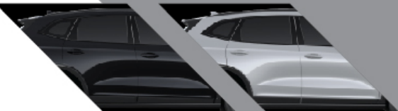
SUN BLACK : สีดำ