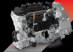
1.5L HYBRID ENGINE เครื่องยนต์ 1.5 ลิตร ทำงานร่วมกับมอเตอร์ไฟฟ้า ให้กำลังสูงสุด 190 แรงม้า และแรงบิดสูงสุด 375 นิวตัน-เมตร

SMOOTH เร่งแรง ไม่สะดุด EFFICIENCY พลังเต็มประสิทธิภาพ ตอบสนองในทุกการขับขี่