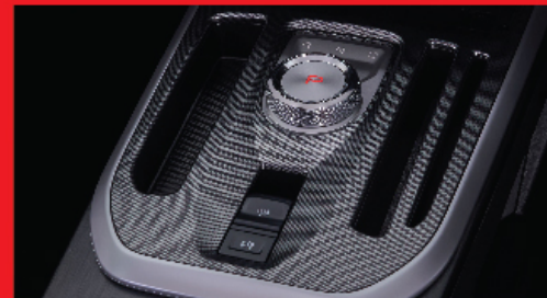
ELECTRONIC SHIFTER ชุดเกียร์ดีไซน์ล้ำ พร้อมสีพิเศษแบบ HIGH-GLOSS ระบบเบรกมือไฟฟ้า พร้อมระบบ AUTO BREAK HOLD