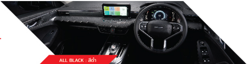
ALL BLACK : สีดำ