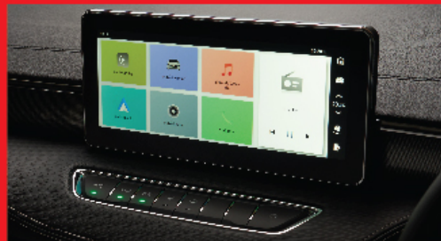
TOUCH SCREEN MULTIMEDIA DISPLAY หน้าจอสัมผัสขนาด 10.25" รองรับการเชื่อมต่อ APPLE CARPLAY® และ ANDROID AUTO™